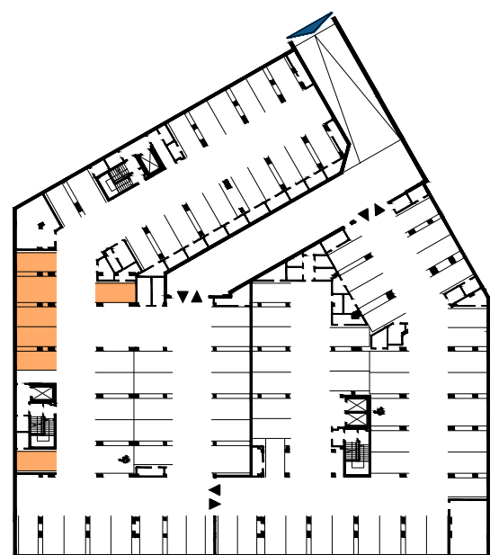
GARAŻ BUDYNEK C